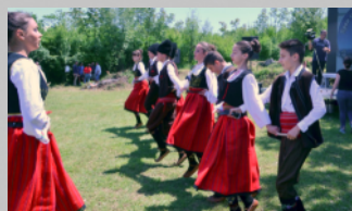
ANIP "ĐURDEVANSKO KOLO" - Podgorica