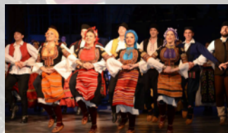
KUD „ABRAŠEVIĆ“ - Kraljevo - Srbija