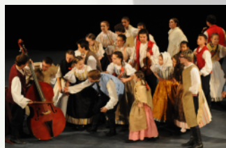
Children folklore ensemble "USMEV OPAVA" - Češka