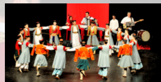
KUD "ZAHUMLJE" - Nikšić