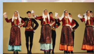
F.A.JU KIC "BUDO TOMOVIĆ" - Podgorica