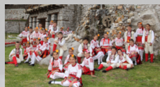
Folk Dance Group "DETSTVO" - Bugarska