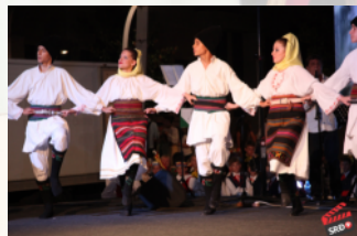
PFA "MONTE FOLK" - Podgorica