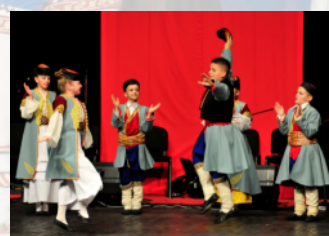
DFA "MONTE FOLK" - Podgorica