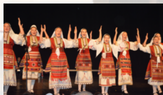
KUD "IGALO" - Igalo